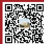
西華大學研究生公眾號

諮詢電話：028—87720075 傳真：028—87720075 通訊地址：四川省成都市郫都區紅光大道9999號 郵政編碼：610039 歡迎訪問我校主頁： http://www.xhu.edu.cn 研招辦E-mail信箱： yjs@mail.xhu.edu.cn